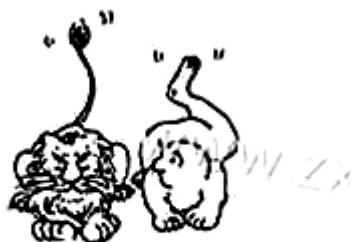
图3 《学习先进经验》 (赵汀阳,《读书》)