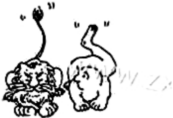
图3 《学习先进经验》 (赵汀阳, 《读书》)