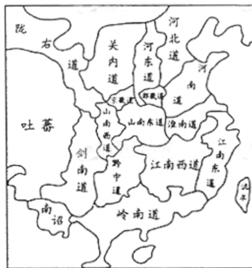
图2 唐开元十五道示意图