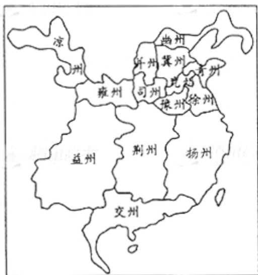
图1 东汉十四州示意图